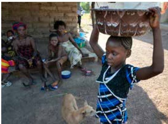
Nach der Halbtagschule muss dieses Mädchen in Sierra Leone als Straßenverkäuferin arbeiten.

Und dann kam um die Jahreswende „Brot für die Welt“. Die Zusage des Presbyteriums, jeden Euro, der in der Gemeinde gespendet wird, aus seinen Verfügungsmitteln zu verdoppeln, forderte offenbar viele Distelnerinnen und Distelner heraus: 9000 Euro gaben sie bar oder per Überweisung in der Friedenskirche ab. 18 000 Euro helfen nun also dabei, die Ziele der 62. Spendenaktion umzusetzen: Mahlzeiten für Kinder in Straßenschulen in Paraguay, Unterstützung von Familien in Sierra Leone und auf den Philippinen – damit Kinderarbeit nicht mehr nötig ist. Wir sind einfach überwältigt von diesem Spendenergebnis!